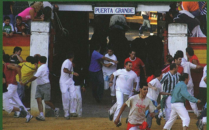
PREMIO ESPECIAL ENCIERROS BILBILTANOS: "Puerta Grande"

PREMIO ESPECIAL ENCIERROS BILBILTANOS "EDUARDO RUBIO GOMEZ (EL TATO)"