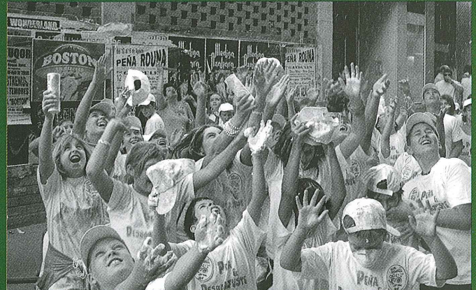
1.º PREMIO: "AGUA- AGUA....." Autor: Angel Esteban Clemente