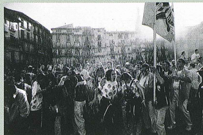
Segundo premio del IV concurso de fotografía organizado por Federación Interpeñas de San Roque "Agua fresca"

Las obras premiadas y seleccionadas para la Exposición quedarán en poder de esta Federación, (las no premiadas se devolverán a los autores) reservándose los derechos a los autores de las mismas, si bien la Federación podrá reproducirlas en la prensa y folletos informativos de ésta. La devolución del resto de las obras se efectuará antes de 60 días después de la clausura de la Exposición, por el mismo conducto que se reciban, no responsabilizándose de los daños que puedan sufrir las mismas, si bien se garantiza un esmerado trato.