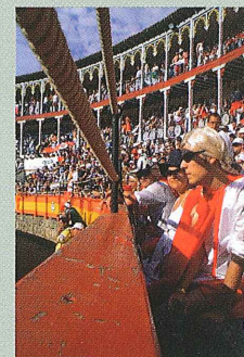
Finalista del IV concurso de fotografía organizado por Federación Interpeñas de San Roque "Tarde de Toros"