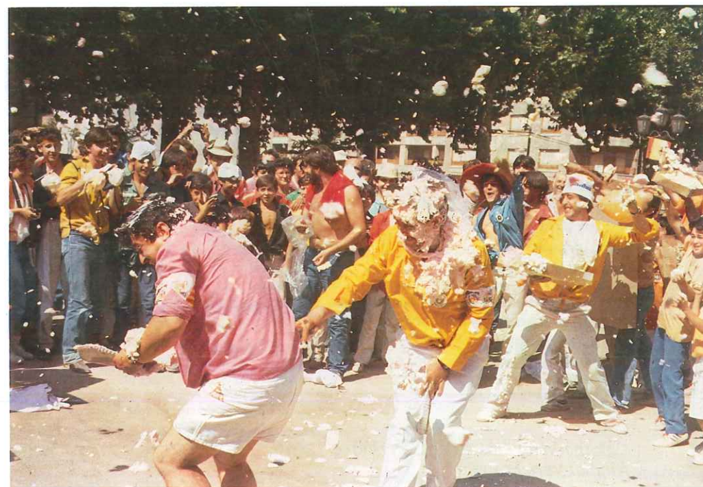
"Guerra de Merengues"

Vamos a juntarnos con la Charanga que se nos hace de noche y da-mos el coñazo por las calles del pueblo... Otra vez nos han jodido con la ce-na, pero no te des mal, haber si el conjunto es mejor. Ya es hora de que nos den algo dulce, vaya tripada de madalenas... y cómo estaba el moscatel... Con esto y un bizcocho hasta mañana a las 8.